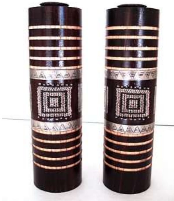
FIGUUR 7 Kontemporêre Zulu-kershouers

3.1 Bestudeer die beeld hier onder en beantwoord die vrae wat volg :