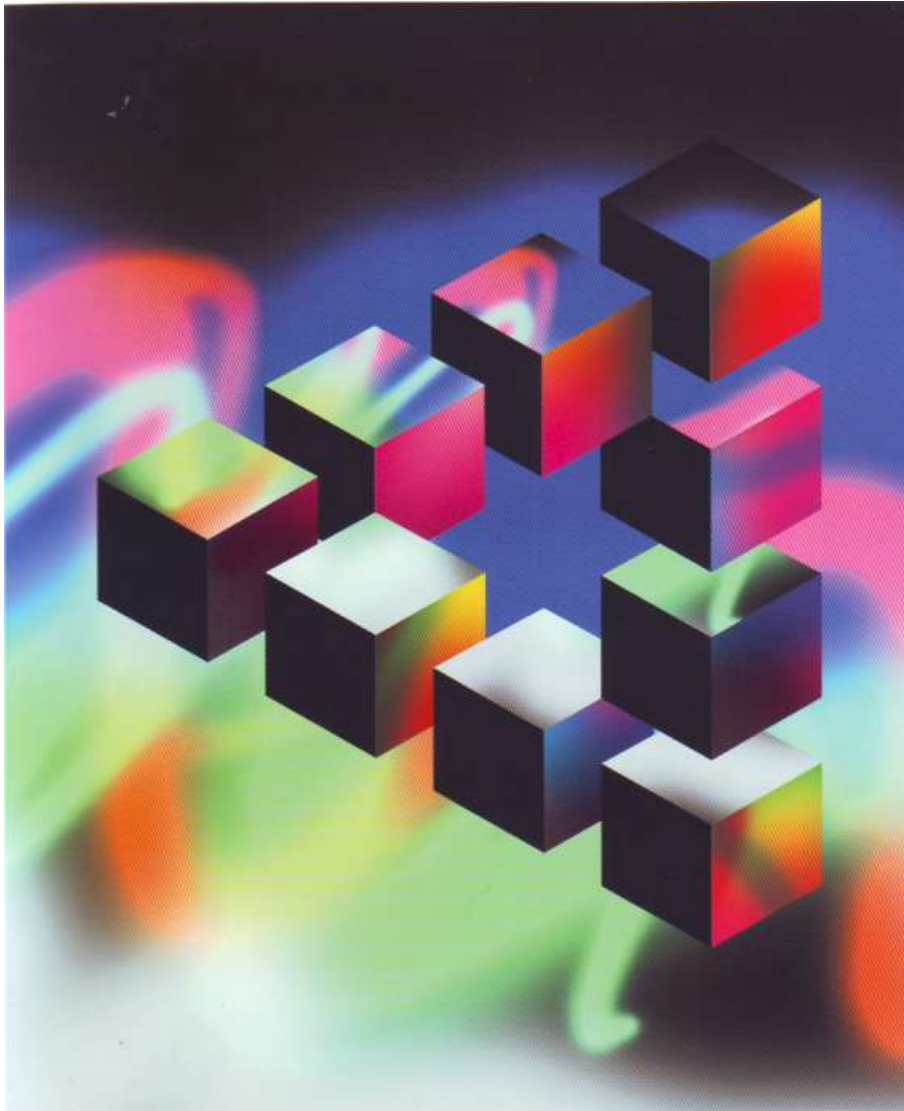
FIGUUR 3 'Infinity' deur die SUBURBIA Ontwerp Agentskap