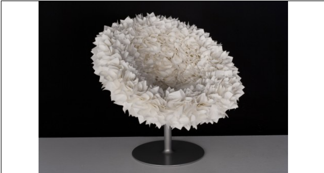
FIGUUR B 'Ruiker' ('Bouquet' stoel) deur Tokuji Yoshioka

Die 'Ruiker' ('Bouquet') stoel is gemaak uit handgevoude lapblokkies wat een vir een aanmekaar gewerk is, om heeltemal die interne oppervlak van die eivormige basis te bedek.'