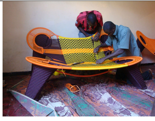
FIGUUR B: Die ‘Madam Dakar’ stoel deur ontwerpers van Afrika, Bibi Seck en Ayse Birsal (2008) vir die Moroso uitstallokaal in Milaan. Hulle gebruik tradisionele weeftegnieke.

3.1.1 Vergelyk die twee ontwerpe hierbo (o.a. bespreek hulle ooreenkomste en verskille) onder die volgende opskrifte: