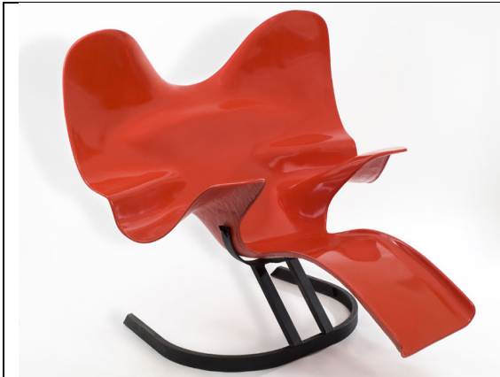
FIGUUR A: ‘Olifant stoel’ deur Bernard Rancillac (1966) Gemaak van plastiek en staal.