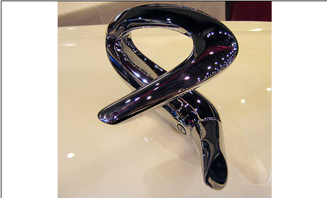
FIGUUR B Tri-Flow kraan deur Zaha Hadid

Die bekroonde argitek, Zaha Hadid het hierdie kraan vir die Britse maatskappy, Triflow Concepts, ontwerp. Die ontwerp lyk soos 'n losstaande, vleklose staal beeldhouwerk en het die vermoë om water op drie verskillende maniere vry te laat; konvensionele warm en koue water stroom uit deur die handvatstel te gebruik en 'n aparte waterweg vir filtreerde drinkwater word geaktiveer deur die elektroniese knoppie te druk.