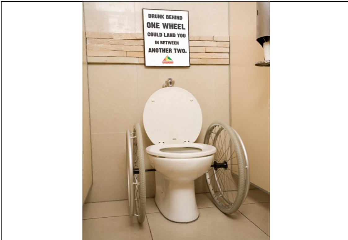
FIGUUR B Rolstoel Plakkaat deur The Jupiter Drawing Room vir die 'Arrive Alive' Veldtog (2007) Suid-Afrika