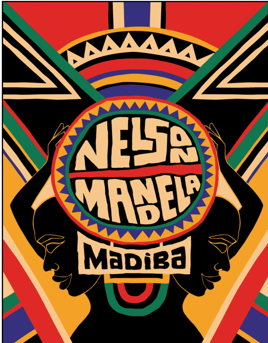
FIGUUR A: Admirable Man (Bewonderenswaardige Man) uit die 95 Nelson Mandela-plakkaatversameling deur Ana Paula Caldas (Suid-Afrika), 2013.

Analiseer die gebruik van die volgende elemente en beginsels van ontwerp ten opsigte van FIGUUR A hierbo: