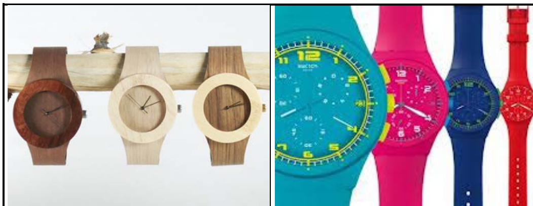
FIGUUR A: Co. se Carpenter-reeks horlosies , gemaak van herwonne hout.