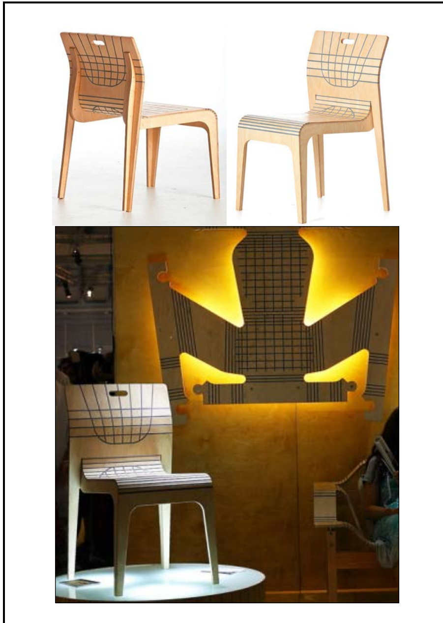
FIGUUR B: Buigbare Platpakstoele deur Wintec se Stratflex-reeks (Suid-Afrika), 2013.

1.2.1 Analiseer en bespreek die gebruik van die volgende ontwerpsterme ten opsigte van FIGUUR B hierbo: