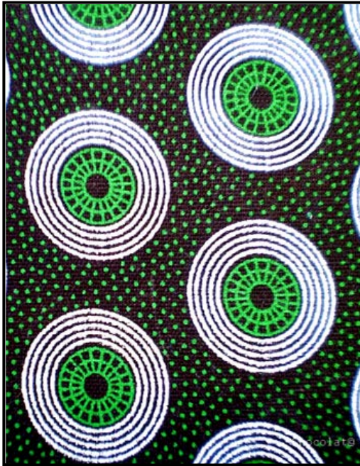
FIGUUR A: Shweshwe-materiaal deur Da Gama Textiles (Suid-Afrika), 2009.