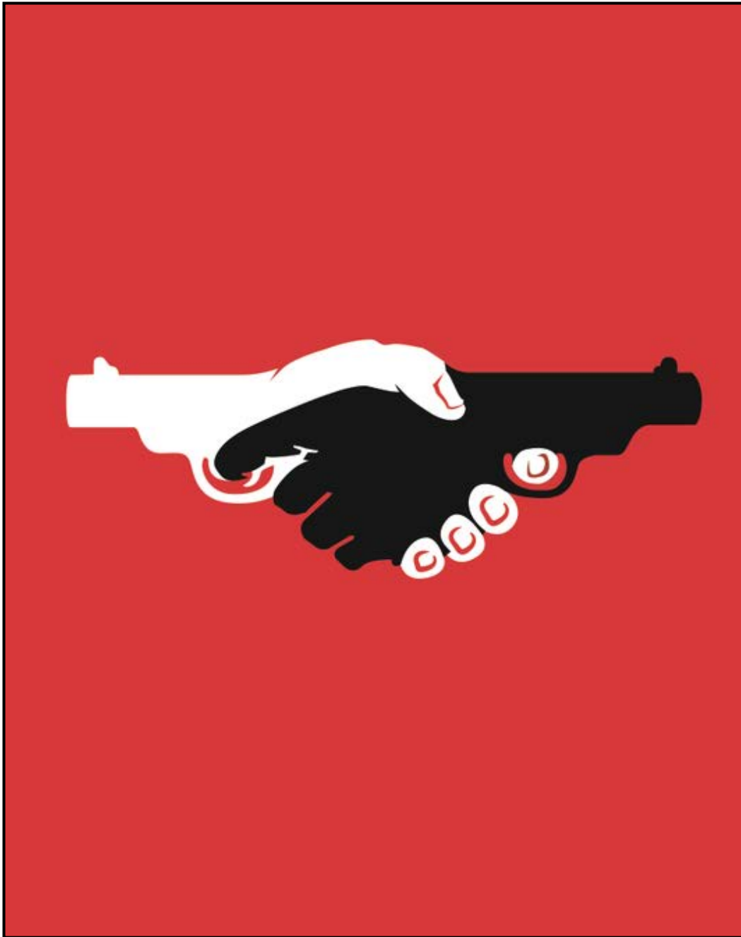
FIGUUR A: 15 de Antirassismefees-plakkaat deur Unusual (VSA), 2005.