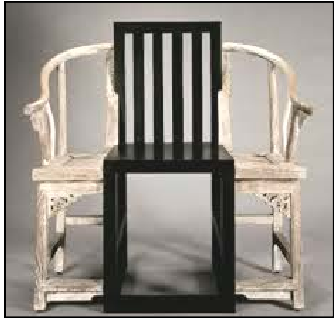
FIGUUR B: Koningstoel deur Shao Fan (China), 1996. (Postmodernisme)

Skryf 'n opstel (ten minste 200–250 woorde of EEN volle bladsy) waarin jy FIGUUR A met FIGUUR B vergelyk. Jou vergelyking moet na die doelstellings, kenmerke en invloede van elke beweging, soos gesien in FIGUUR A en FIGUUR B, verwys.