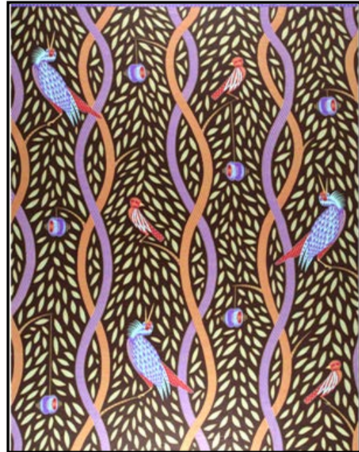
FIGUUR B: Vlisco-materiaal deur Vlisco Fabrics (Demokratiese Republiek van die Kongo), 2007.

Vergelyk die twee tekstielontwerpe hierbo deur die volgende as riglyne te gebruik: