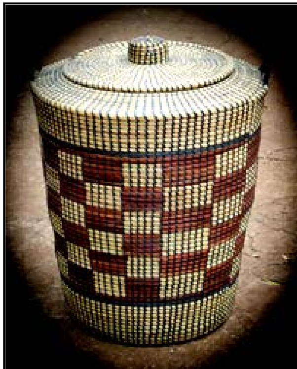
FIGUUR B: Zoeloemandjie deur RootzCreationz (Suid-Afrika), 2013.