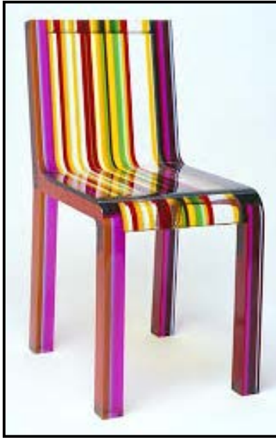
FIGUUR A: Reënboogstoel deur Patrick Norguet (oorsprong en datum onbekend). (Popkuns)