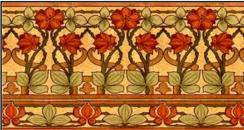
Kuns en Kunsvlyt