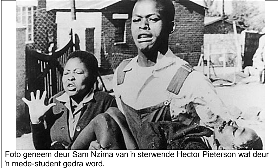
Foto geneem deur Sam Nzima van 'n sterwende Hector Pieterson wat deur 'n mede-student gedra word.

[Bron: www.sahistory.org.za . Toegang op 26 Augustus 2014 verkry]