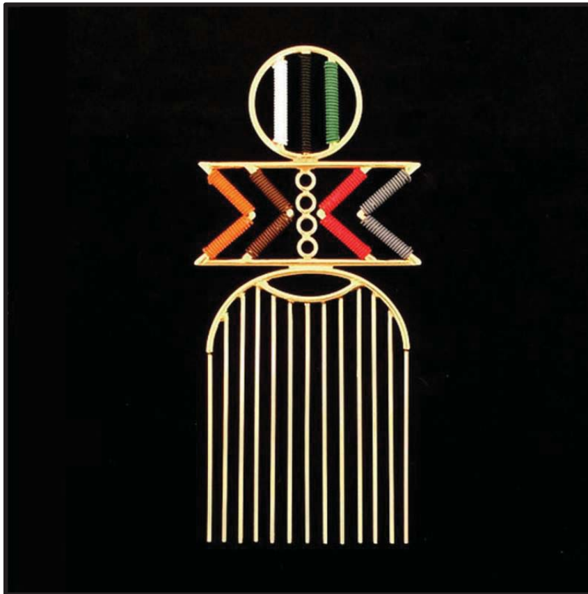
FIGUUR B: Goud-beslaande haarkam deur Michelle Liao (Suid-Afrika), 2017.

Verduidelik die gebruik van die volgende ontwerpsterme in verhouding tot FIGUUR B hierbo: