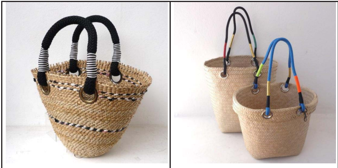
FIGUUR K: Design Afrika het 'n reeks mandjies en sakke wat vir inkopies en die strand geskik is. KAT Shopper and Beach Shopper (Suid-Afrika), 2016.