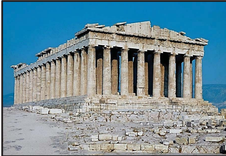
FIGUUR F: Die Parthenon in Griekeland, 800 VC, ontwerp deur Ictinus en Calicrates.