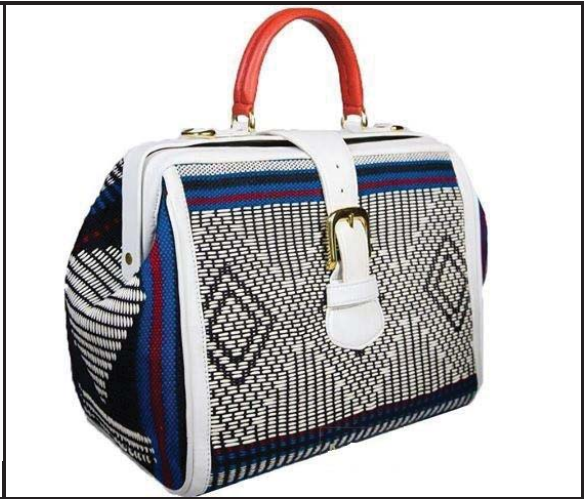
FIGUUR E: Die Mali Handsak , Hamethop, (Suid-Afrika), 2015.

Skryf 'n opstel (ten minste EEN bladsy) waarin jy die handsakke in FIGUUR D en FIGUUR E vergelyk, deur hul ooreenkomste en verskille te bespreek met verwysing na: