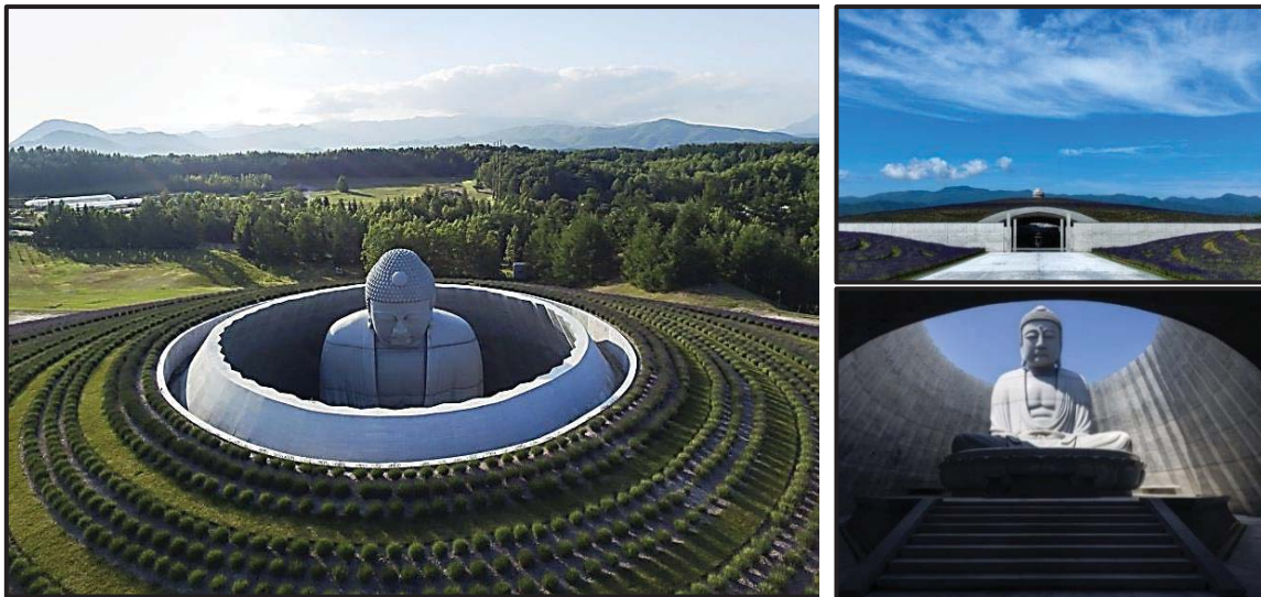
FIGUUR G: Heuvel van die Boeddha-aanbiddingsterrein , Makomanai Takino Begraafplaas, Sapporo, Japan, 2015 deur Tadao Ando.

Skryf 'n VERGELYKENDE OPSTEL (van ten minste EEN volledige bladsy) waarin jy die klassieke gebou in FIGUUR F met die kontemporêre gebou in FIGUUR G hierbo vergelyk. Alternatiewelik kan jy enige klassieke gebou (wat jy bestudeer het) met enige kontemporêre gebou vergelyk.