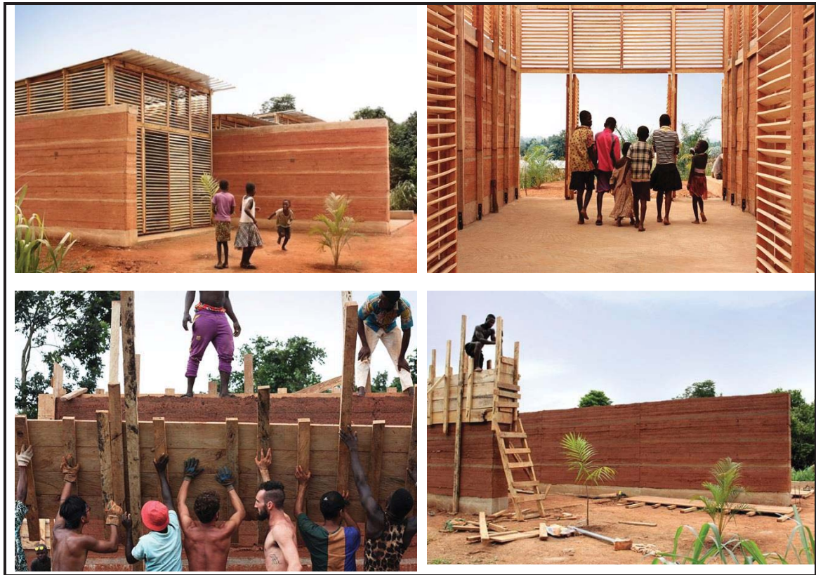
FIGUUR L: Binne-buite skool ('Inside Out School') deur Andrea Tabocchini en Francesca Vittorini, Ghana, 2017.

Soos die naam aandui, vervaag die Binne-buite skool ('Inside Out School') die grense tussen binne en buite. Die gebrek aan hulpbronne en die terreinbeperkings het 'n volhoubare ontwerpstrategie geïnspireer. Die skool is met die hand gebou van materiaal wat op die terrein (grond, hout en plantegroei) beskikbaar is deur 'n span plaaslike werkers en internasionale vrywilligers wat die skool binne 60 dae saamgestel het. 'n Ligte houtstruktuur lig die dak op en die struktuur bevat 'n stoep wat tot in die tuin strek.