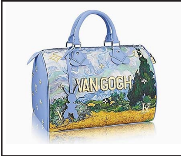
FIGUUR D: Jeff Koons Kunshandsak , Louis Vuitton, 2017.

3.1 Verwys na FIGUUR D en FIGUUR E en beantwoord die vrae wat volg.