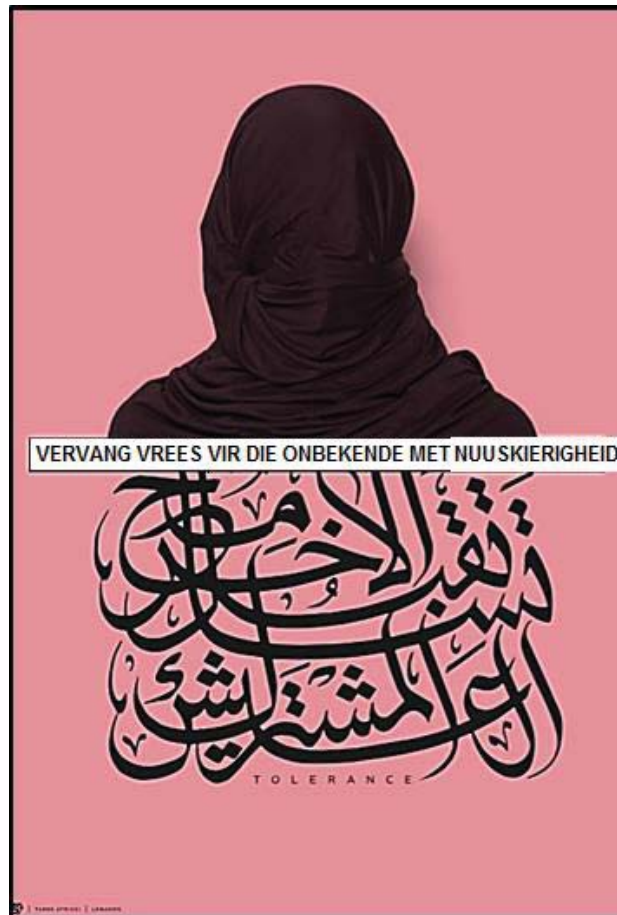
FIGUUR C: 'Vervang vrees vir die onbekende met nuuskierigheid', plakkaatontwerp vir Verdaagsaamheid uitstalling, Tarek Atrissi Ontwerp, 2017.