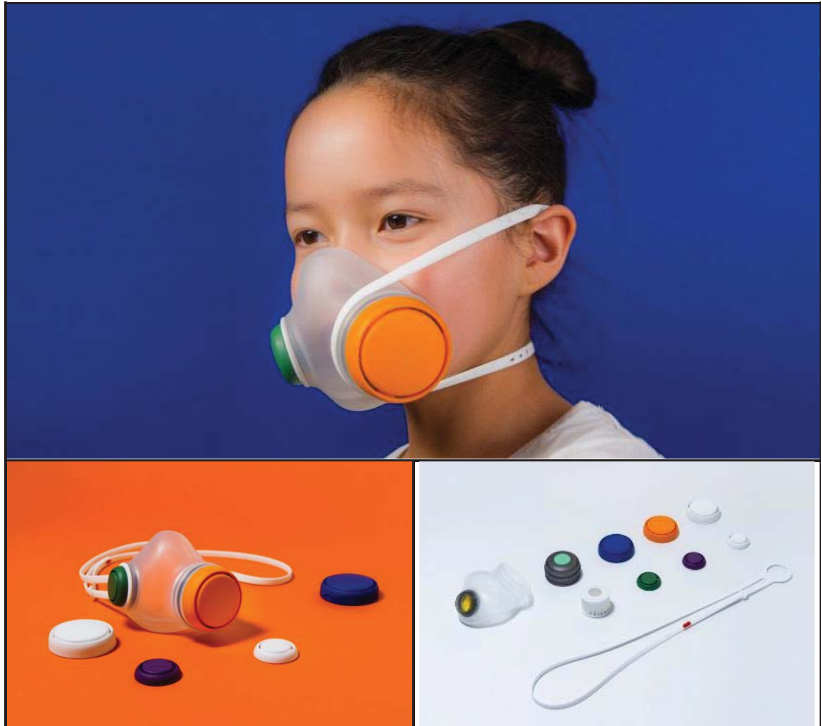
FIGUUR J: Woobi Spel lugbesoedelings-masker is ontwerp om aanloklik vir kinders te wees, 2017.

Die Deense ateljee Kilo Design het 'n masker geskep om kinders wat in gebiede met baie hoë vlakke van lugbesoedeling leef, te beskerm en op te voed. UNICEF statistieke toon dat 300 miljoen kinders woon in plekke met die mees giftige vlakke wat ooit aangeteken is. Die toestel is ontwerp vir kinders ses jaar en ouer.