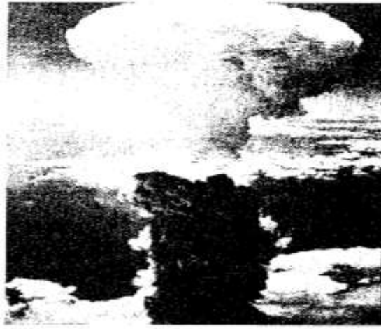
BRON 3: Atoombom-ontploffing

Bestudeer bronne 3 en 4 en beantwoord dan die onderstaande vrae: