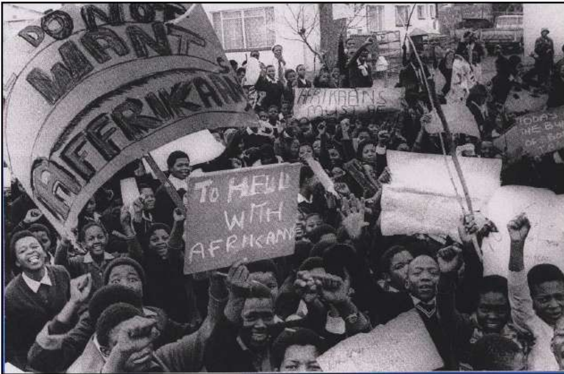
Studente protesteer in Soweto in 1976

BRON 8: Verwys na Bron 8 en beantwoord dan die onderstaande vrae.