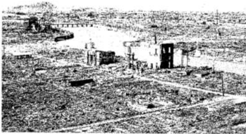
BRON 4: Japanse stad na die eerste atoombom