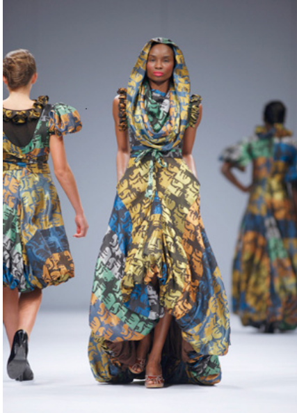
'n Suid-Afrikaanse tekstielontwerp deur Palesa Mokubung vir Mantsho-tekstiele. Dit is 'n vermenging van Westerse 1950's vorms en Afrika-kleure en -rokstyle.

Skep 'n ontwerp in jou dissipline wat Suid-Afrika se multikulturele samelewing reflekteer. Verken simbole, beelde, patrone, woorde, gesegdes, strukture, ens., wat verskillende kulture wat in ons land woon reflekteer en integreer dit om 'n verenigde, tog lewendige ontwerp te skep. Gebruik die beelde hieronder as inspirasie.