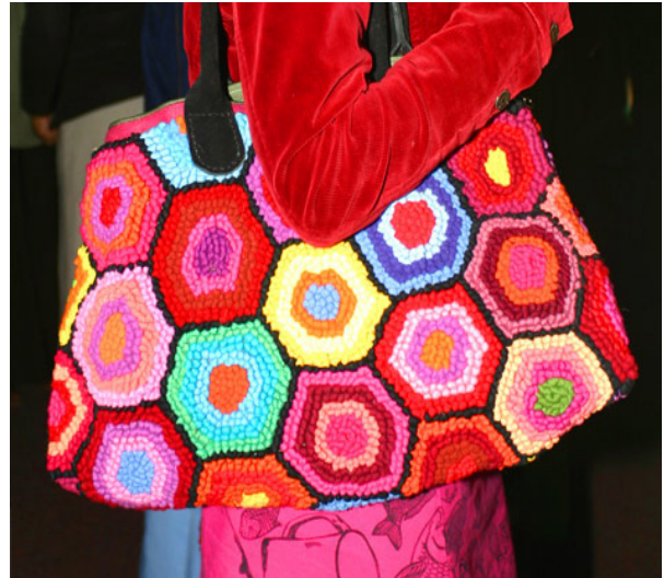
'n Sak deur Mielie gemaak van katoenstroke