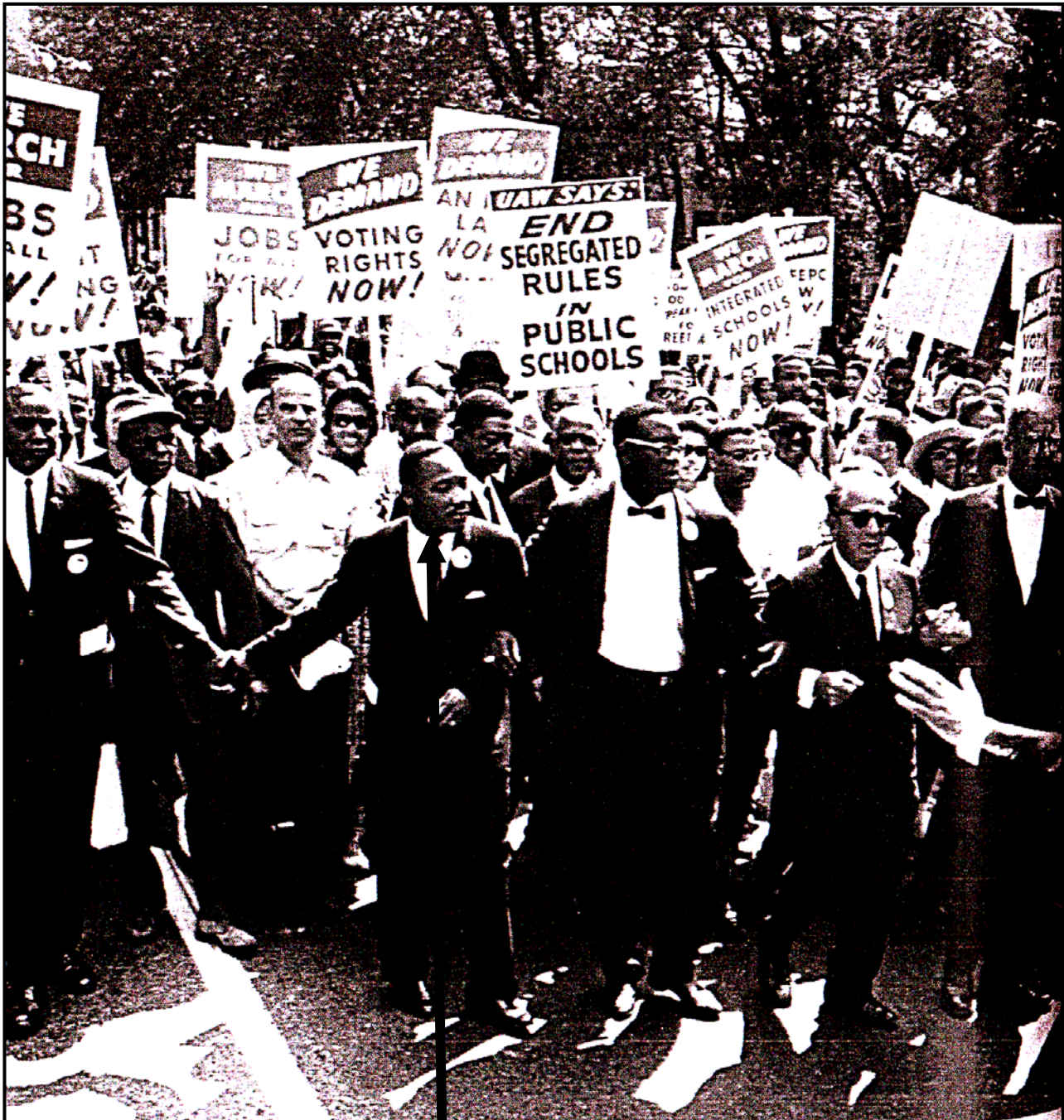
Martin Luther King Jr.