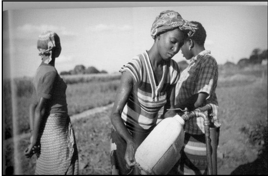
[Se qotsitswe makasineng wa Abucus: Phato 2009: 89]