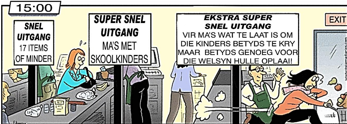
[Uit: Afrikaans is lekker, LB. Gr 12. 2007]

Die vrae wat volg, is op die prent hieronder gebaseer.