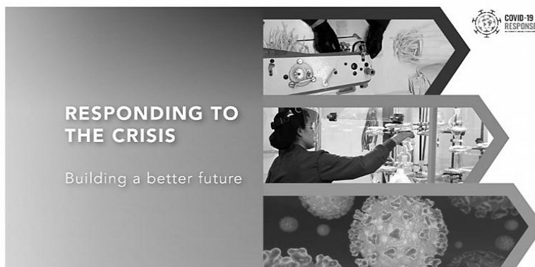
Figuur 1: https://www.unido.org/news/covid-19-responding-crisis-building-better-future

Soos wat die COVID-19-virus vanaf laat 2019 tot in 2021 versprei het, het die regering groot byeenkomste beperk en mense aangeraai om sosiale afstandhouding toe te pas. Inperkings wat bedoel was om die verspreiding van die virus te keer, het bykans elke fase van die lewe en die manier waarop dinge altyd gewerk het, verander.