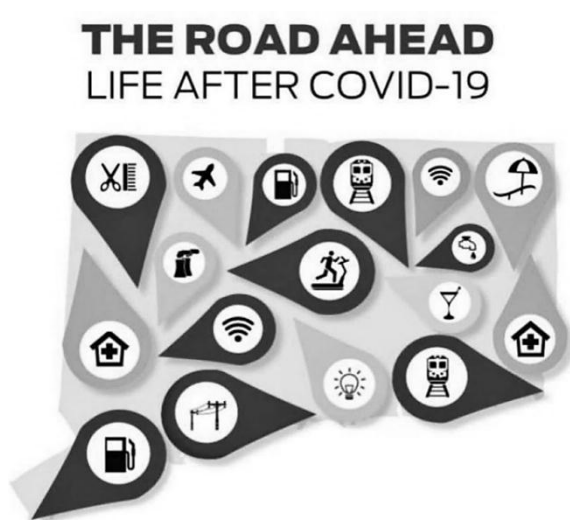
Figure 2: https://www.bbc.com/future/article/20200527-coronavirus-how-covid-19-could-redesign-our-world