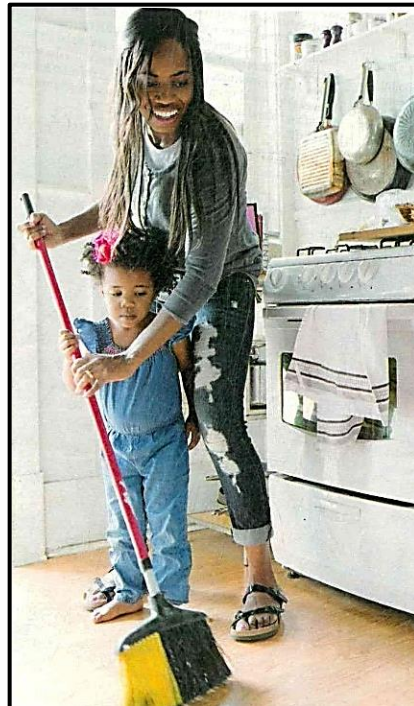
[Setshwantsho se qotsitse ho Jet Club Loetse 2018.]