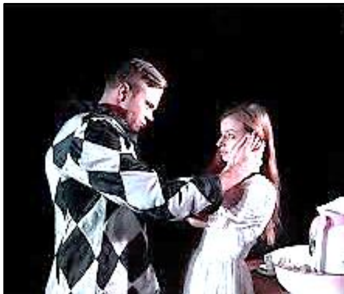
[Bron: 'n Produksie van Mis deur André Stolz]

Bestudeer BRON O hieronder en beantwoord die vrae wat volg.