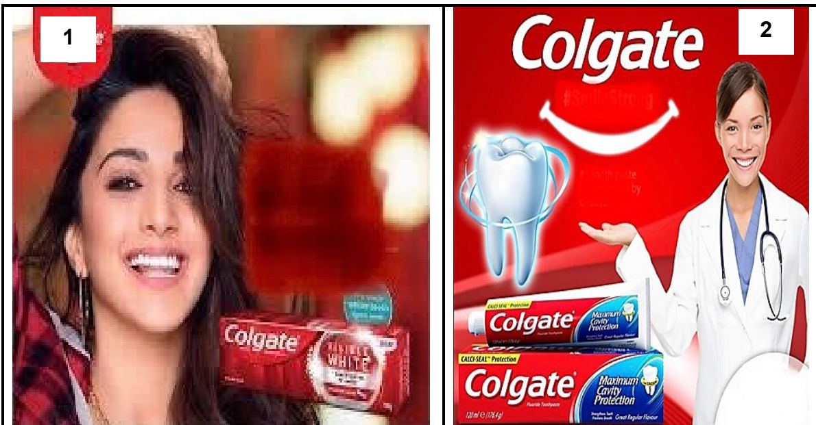
[E qotsitse le ho hlophisetwa tlhahlobo ho tswa ho google]