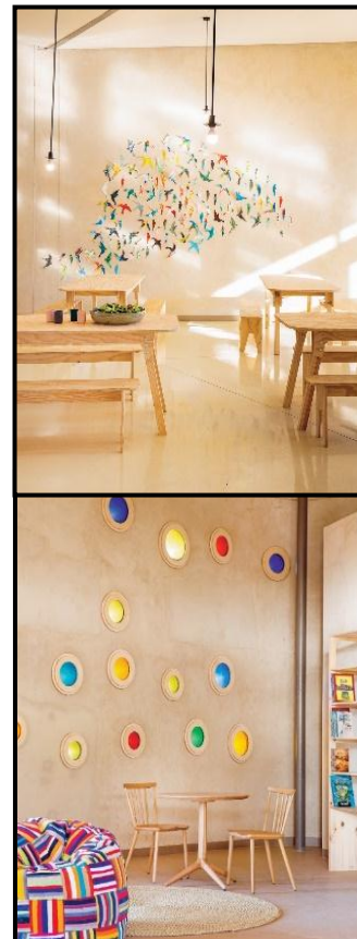
FIGUUR 8c: Binne-aansigte van die skool.