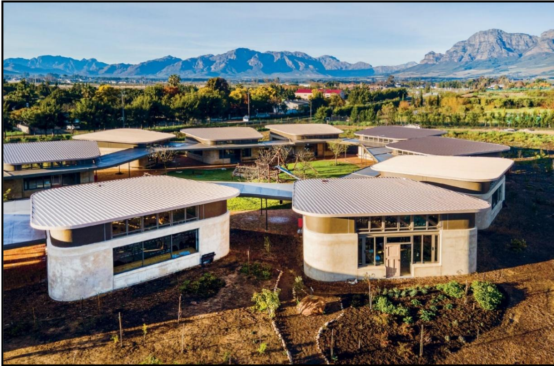
FIGUUR 8a: Fabio Venturi (Terramanzi Group), Green School South Africa (Groen Skool Suid-Afrika) (GSSA) , Paarl (Wes-Kaap), beton en herwinde materiale, 2022.