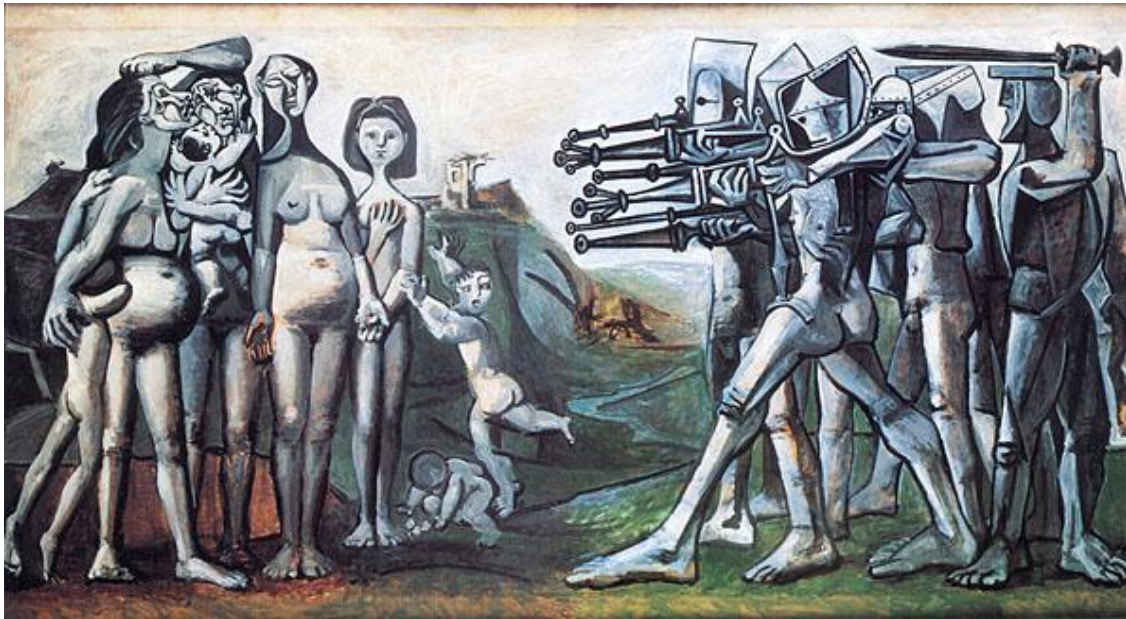
FIGUUR 3a: Pablo Picasso, Massacre in Korea (Slagting in Korea) , olie op doek, 1951.