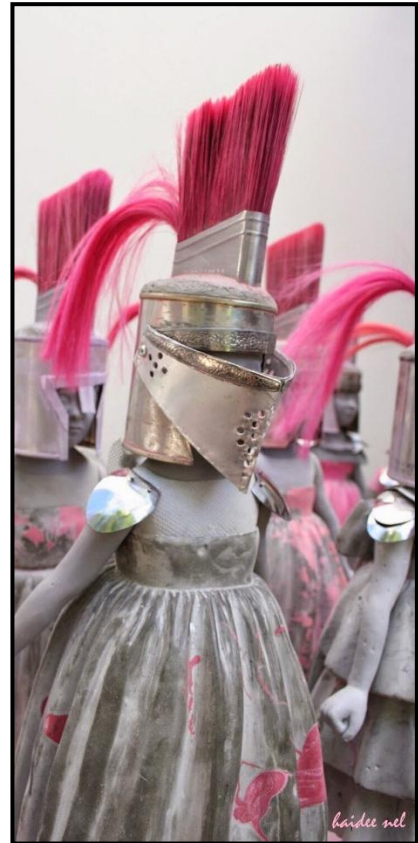
FIGUUR 7a en 7b (detail): Haidee Nel, Infantry Children/Kaalvoetsoldate (Barefoot Soldiers) , beeldhou-installasie, gemengde media (sement, plastiek, metaal, kwasse en marmer), 2015.