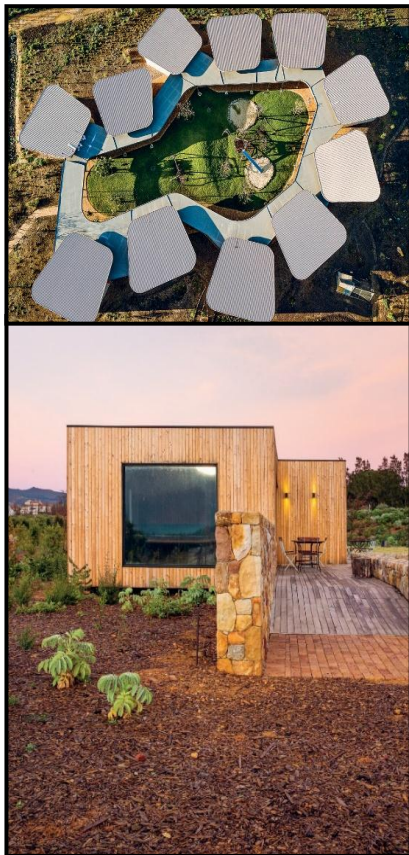
FIGUUR 8b: Die boonste foto dui 'n lugaansig op die skool aan. Die onderste foto toon die groot vensters wat verseker dat die skool se tuine uit al die klaskamers en ander geboue sigbaar is.