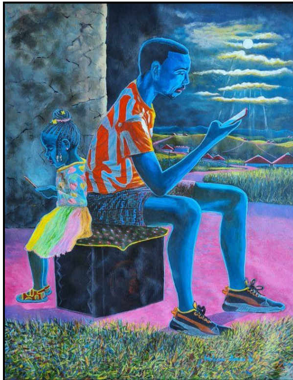
FIGUUR 6a: Welcome Danca, So Near and Yet So Far (So Naby en Tog So Ver) , olie en akriel op doek, 2021.