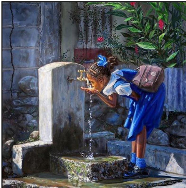
FIGUUR 1b: Jonathan Guy-Gladding, Stand Pipe #3 (Standpyp #3) , olie op doek, c. 2019.