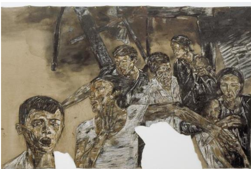
FIGUUR 3c: Leon Golub, Vietnam II (detail) (Viëtnam II) , akriel op doek, 1973.