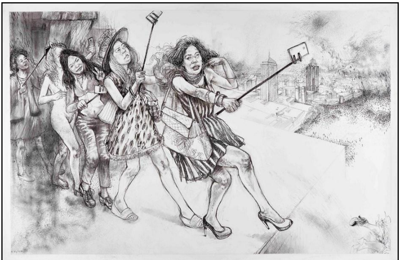
FIGUUR 6b: Diane Victor, The Parable of the Selfie and the Self-perpetuating Problem (Die Gelykenis van die Selfie en die Oneindige Probleem) , houtskool, pastel en as op papier, 2015.