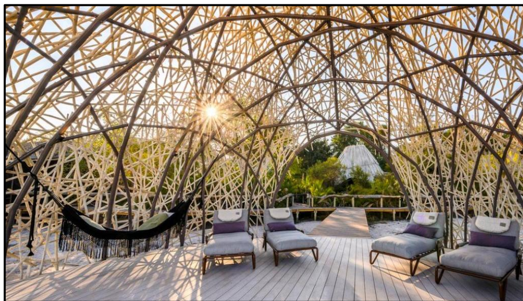
FIGUUR K: Voëlnes('Bird's Nest')-swembadtuinhuisie (’n buitelug-struktuur wat skadu teen die son verskaf en vir buitelugonthaal gebruik kan word), Jao Kamp Okavango Delta-lodge (Botswana), 2022.

5.2.1 Verduidelik die rol wat Inheemse Kunshandwerk-tegnieke in die Suid-Afrikaanse toerismebedryf kan speel met verwysing na die ontwerp in FIGUUR K hierbo. (2)