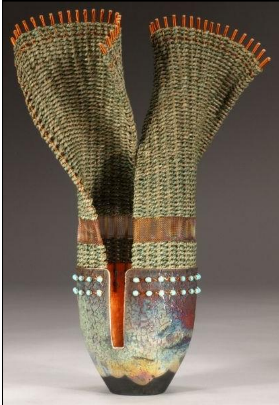
FIGUUR B: Raku-gebakte keramiek- en mandjiewerk-houer deur Willow Bend Studio-ontwerpers Marc Jenesel en Karen Pierce (VSA), 2018.

1.2.1 Analiseer die ontwerp in FIGUUR B hierbo deur na die volgende te verwys: