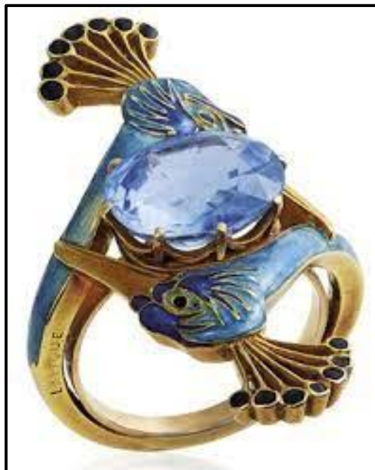
FIGUUR I: Art Nouveau-ring deur René Lalique (Frankryk), circa 1900.

Skryf 'n opstel (ten minste EEN bladsy) waarin jy die ringe in FIGUUR H en FIGUUR I hierbo vergelyk en verduidelik hoe hulle tipies is van die bewegings wat hulle verteenwoordig.