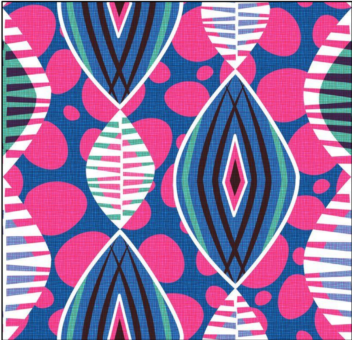
FIGUUR A: Tekstielontwerp ter ere van Swart Geskiedenis-maand ('Black History Month') deur Spoonflower (VSA), 2020.

1.1.1 Analiseer die gebruik van die volgende elemente en beginsel in FIGUUR A hierbo: