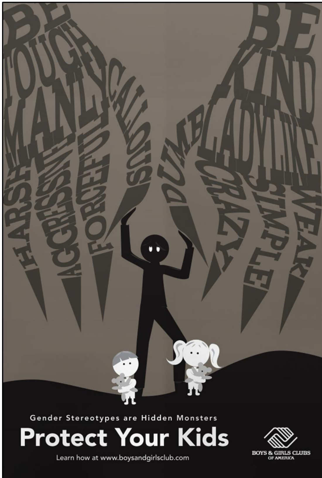
FIGUUR C: Geslagstereotipe-veldtogplakkaat deur Lindsay Helms (VSA), 2017.

Verduidelik hoe beelde en teks gebruik word om die boodskap van geslagstereotipering in FIGUUR C hierbo oor te dra.