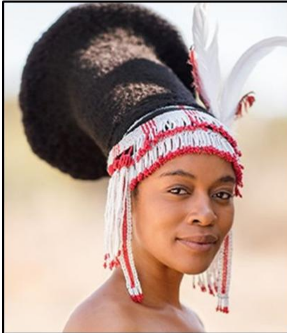
FIGUUR D: Tradisionele amaZulu-haarstyl (Suid-Afrika), 2022.