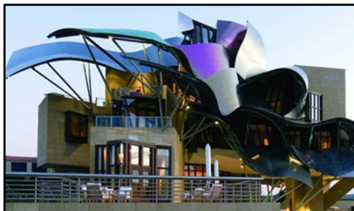
FIGUUR G: Marqués de Riscal Hotel- en Wynkelder-kompleks deur Frank Gehry (Spanje), 2006.