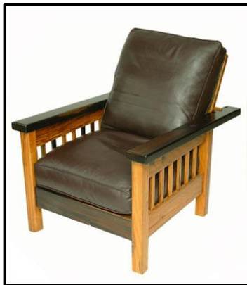
Kuns en Kunsvlyt